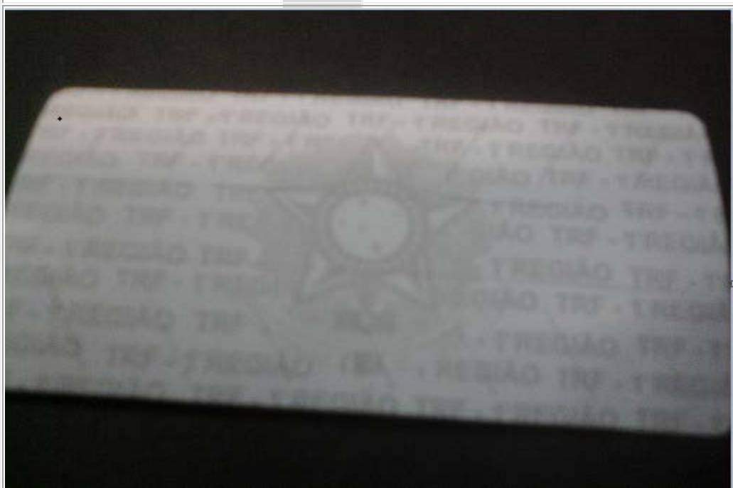
DETALHE DA IMPRESSÃO - EM MARCA D'ÁGUA