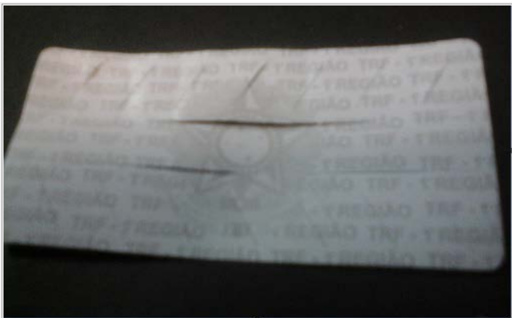
DETALHE DA MICROSSERRILHA